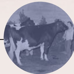
Agro Acres Marquis Xmas Pansy et Marquis Patsy, 1969