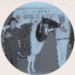
Brookview Tony Charity en 1987

Brookview Tony Charity, qui a fait la une de l'exhibit Hanover Hill Holsteins de Port Perry (Ontario) , et qui a plus tard appartenu à Romandale Farms de Unionville (Ontario), est la seule vache Holstein à avoir été Grande Championne 4 fois, soit en 1983, 1984, 1985 et 1987. Deux taureaux Holstein ont été déclarés Grands Champions à 4 reprises : Abbekerk Sylvius Lad, exposé par J.W. Innes & Sons de Woodstock (Ontario) et plus tard, par Lonsdale Farm de Sussex (N.-B.) en 1927, 1930, 1931 et 1932, ainsi que Rockwood Rocket Tone en 1951, 1952, 1953 et 1955 pour Quinte District Breeding Association de Belleville (Ontario).