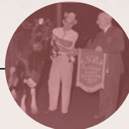
La Grande Championne de 1958 - Silvia Pabst Texal

Sept femelles ont été Grandes Championnes 3 fois au jugement Holstein : Montvic Rag Apple Bonheur (1934, 1935, 1936), Rosehill Fayne Wayne (1946, 1948, 1951), Spring Farm Juliette (1949, 1950, 1953), Silvia Pabst Texal (1957, 1958, 1959), Bond Haven Signet Sally (1961, 1962, 1963), Acme Star Lily (1997, 1998, 1999) et Thrulane James Rose (2006, 2008, 2009). Les 2 taureaux qui ont décroché 3 titres de Grand Champion sont Johanna Rag Apple Pabst (1926, 1928, 1929) et Zeldenrust Fond Memory (1971, 1973, 1974).