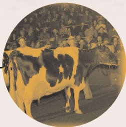
La réserve Spring Farm Juliette avec la Grande Championne Rosehill Fayne Wayne en 1951

Brookview Tony Charity, qui a fait la une de l'exhibit Hanover Hill Holsteins de Port Perry (Ontario) , et qui a plus tard appartenu à Romandale Farms de Unionville (Ontario), est la seule vache Holstein à avoir été Grande Championne 4 fois, soit en 1983, 1984, 1985 et 1987. Deux taureaux Holstein ont été déclarés Grands Champions à 4 reprises : Abbekerk Sylvius Lad, exposé par J.W. Innes & Sons de Woodstock (Ontario) et plus tard, par Lonsdale Farm de Sussex (N.-B.) en 1927, 1930, 1931 et 1932, ainsi que Rockwood Rocket Tone en 1951, 1952, 1953 et 1955 pour Quinte District Breeding Association de Belleville (Ontario).